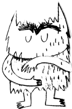
calm /ka:m/ - spokojny