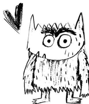
in love /in lav/- zakochany