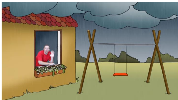
Are You Happy? Are You Sad? | English For Children | Learn English For Kids